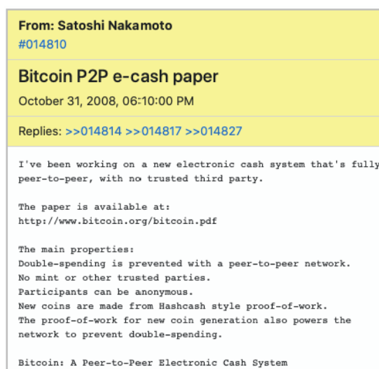
Imagen 1. Mensaje de Satoshi Nakamoto